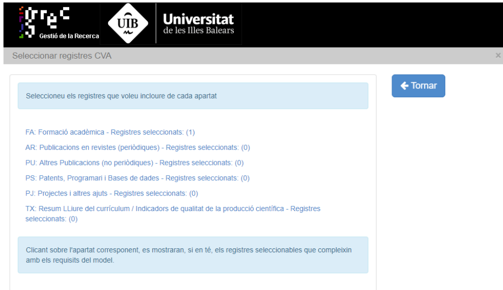
Imatge 5.- Apartat de selecció de registres per a la generació del Currículum Vitae Abreviat (CVA)

Per incloure (o llevar) registres, heu de fer clic damunt el nom de cada entorn i, a la llista d'ítems que us sortirà associada a l'entorn (tots pertanyents al vostre currículum), heu de marcar o desmarcar els registres que voleu incloure o llevar del CVA (veure Imatge 6 a continuació).