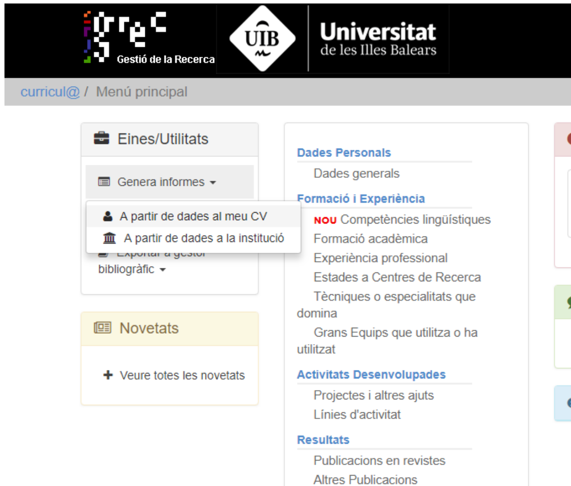
Imatge 1.- Accés a l'opció "Genera informes" de Curricul@ GREC

Per generar-ho, una vegada dins del vostre perfil de GREC, cal que aneu a la part esquerra de la pantalla i entreu dins l'apartat "Genera informes" -> "A partir de dades al meu CV" (veure Imatge 1 a continuació).